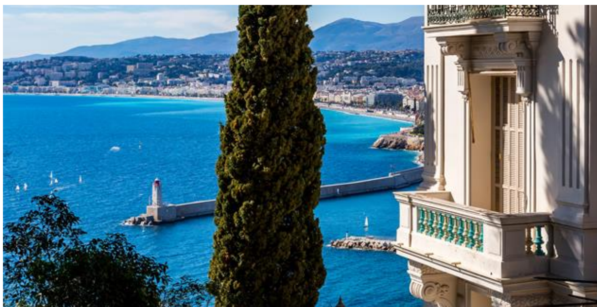
06 Nice Palais Miramar

Depuis sa création, le label est devenu un projet de territoire, un outil mettant en synergie le patrimoine, l'architecture, l'urbanisme, le paysage, l'éducation et le tourisme.